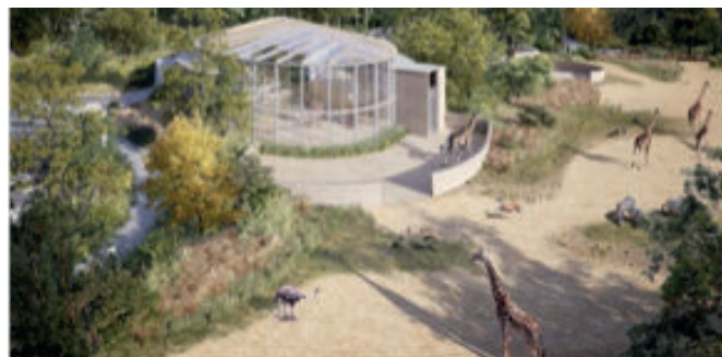
Girafes, hippopotames ou encore gazelles se partageront l'espace (Architectes Fabre Speller)