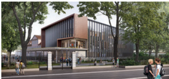
Formats Urbains Architectes Associés

• Rénovation lourde du collège Villon pour 22,2 M€ et bientôt, la construction d'un nouveau collège à Mulhouse !