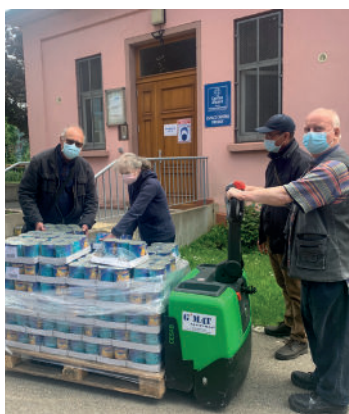
Des associations d'entraide