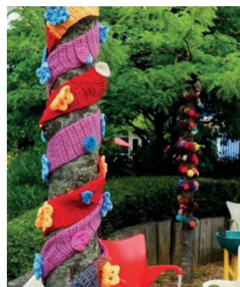
Le Gang des tricoteuses