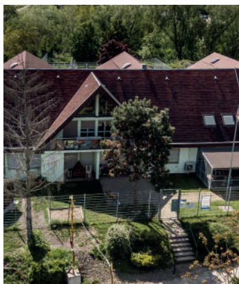
La SPA de Mulhouse