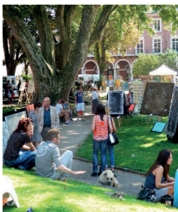
Le Marché des Arts