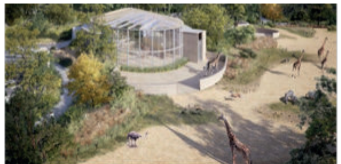
Girafes, hippopotames ou encore gazelles se partageront l'espace (Architectes Fabre Speller)