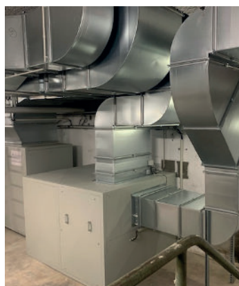
La chaufferie de l'église du Sacré-Cœur