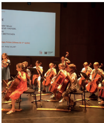
Le Conservatoire à rayonnement départemental Huguette-Dreyfus

Parce qu'elles sont un lien social irremplaçable, nous avons utilisé notre dotation personnelle du Fonds d'intervention départemental pour soutenir financièrement 79 associations et structures locales