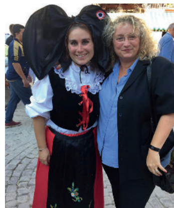
Les Vitrites de Mulhouse