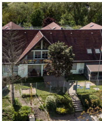
La SPA de Mulhouse