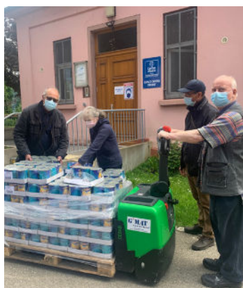
Des associations d'entraide