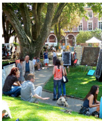
Le Marché des Arts