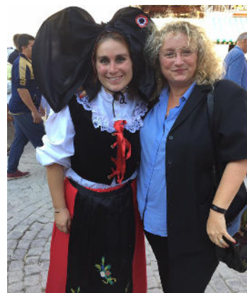
Les Vitrites de Mulhouse