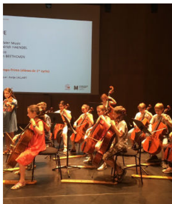
Le Conservatoire à rayonnement départemental Huguette-Dreyfus

Parce qu'elles sont un lien social irremplaçable, nous avons utilisé notre dotation personnelle du Fonds d'intervention départemental pour soutenir financièrement 79 associations et structures locales