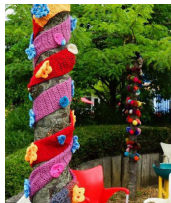
Le Gang des tricoteuses