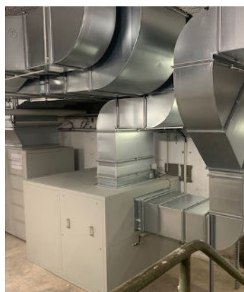
La chaufferie de l'église du Sacré-Cœur